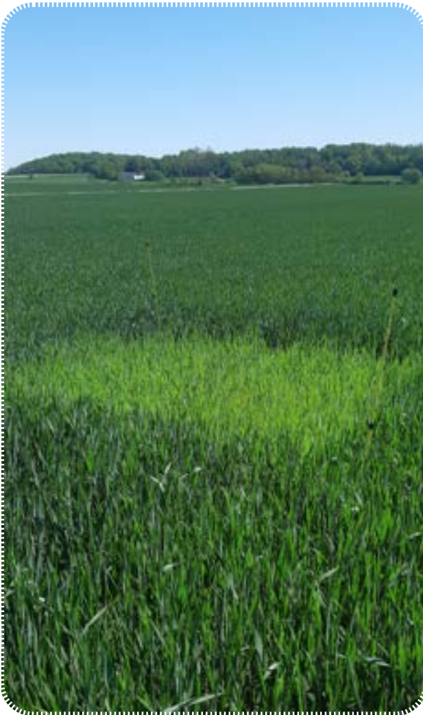
Bilden visar Reform 170 kg

Håll koll på nollrutan i höstvetete – är det bra förutsättningar kan man behöva tänka över kvävestrategin.